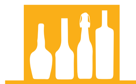
CONSUMO ABUSIVO DE ALCOHOL