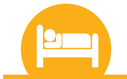
DESCANSA Y CUIDA LA CALIDAD DEL SUEÑO