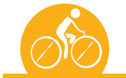
HAZ EJERCICIO REGULARMENTE