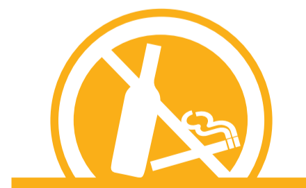
EVITA COSUMIR TABACO Y ALCOHOL