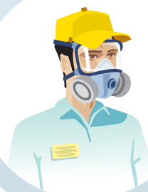
MÀSCARA AMB FILTRES