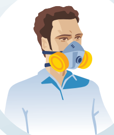
MASCARETA AMB FILTRES