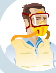
EQUIP DE RESPIRACIÓ AUTÒNOM

Per ser efectius, els equips respiratoris han de quedar perfectament ajustats a la cara.